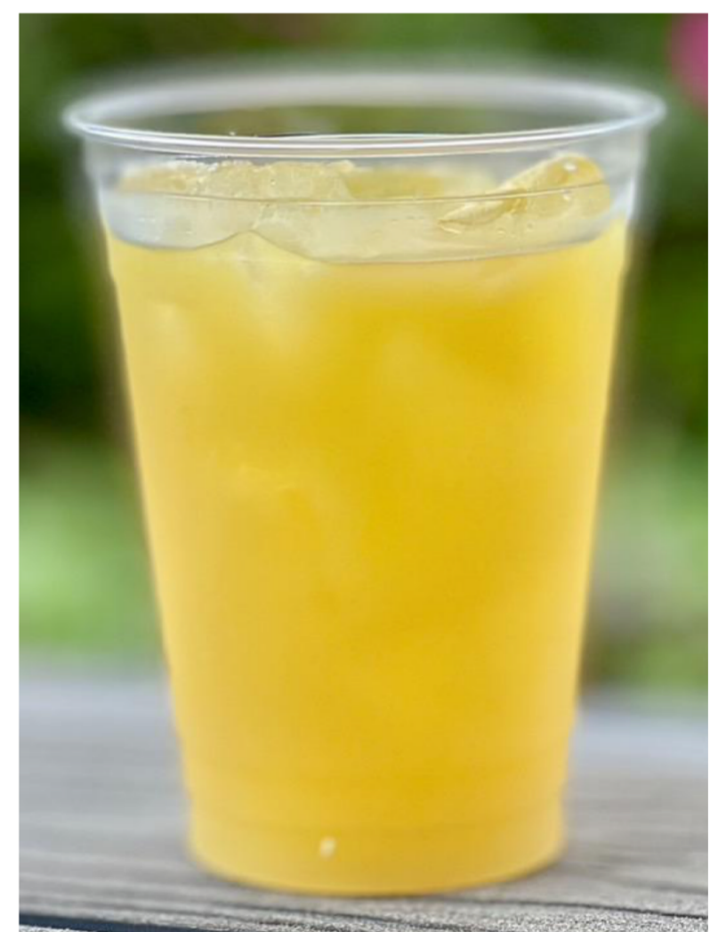
レモンコーラ ジンジャーエール オレンジジュース 各¥300