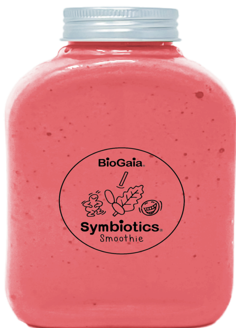
スムージー (グリーン・いちご) ¥1,000