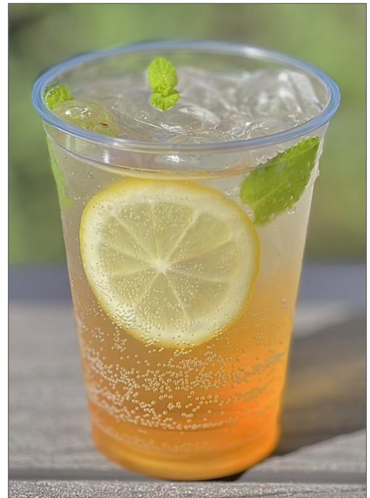
梅レモンスカッシュ ¥500